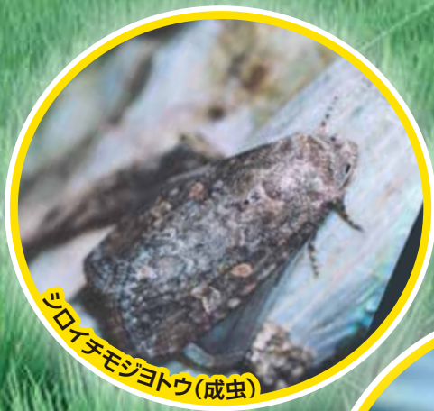
シロイチモジヨトウ(成虫)