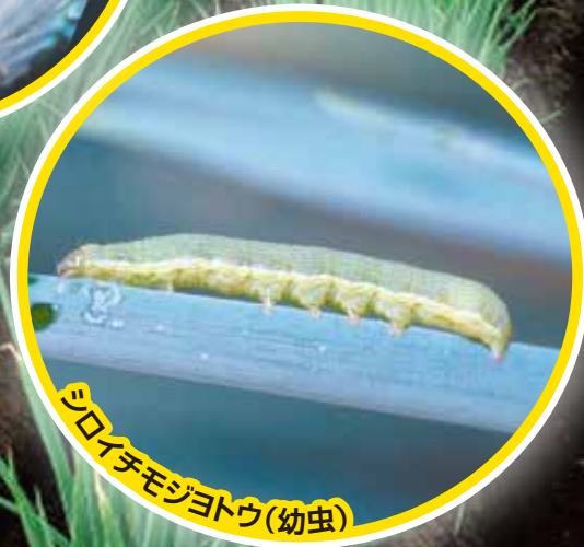
シロイチモジヨトウ(幼虫)