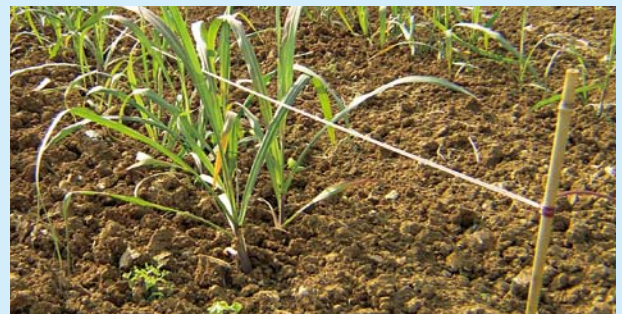
ロープ状製剤の取付け例