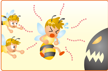
警報フェロモンのイメージ