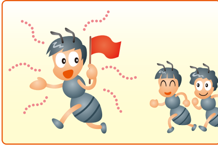
道しるべフェロモンのイメージ