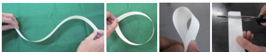
PBN テープ PBN Tape