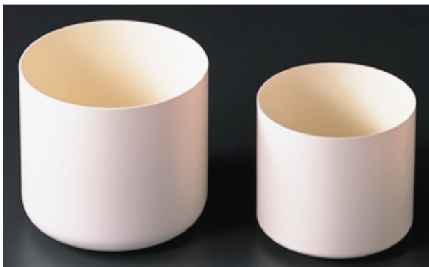
単結晶製造用・粉体合成用・分析用 PBN ルツボ crucibles for single crystal growth or analysis