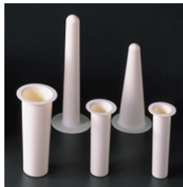
蒸着用・MBE 用 PBN ルツボ crucibles for MBE / evaporation