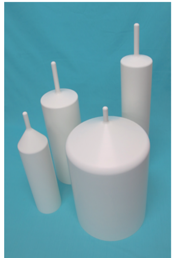
単結晶製造 VGF 用 PBN ルツボ VGF crucibles for single crystal growth